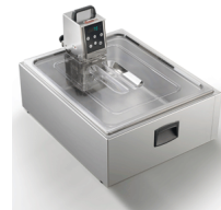
Container 2/1 gastro